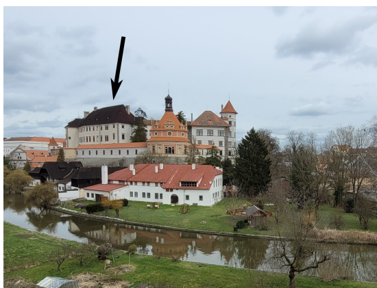
Obrázek k otázce 6