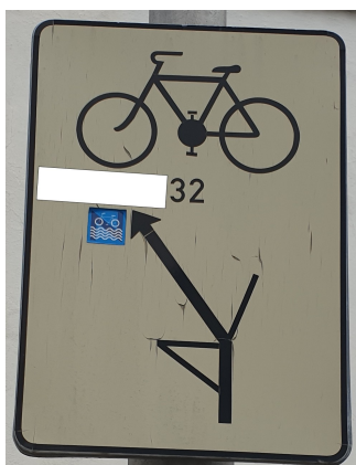
Obrázek k otázce 2